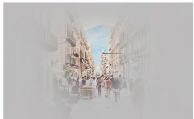
Blick auf eine belebte Straße.